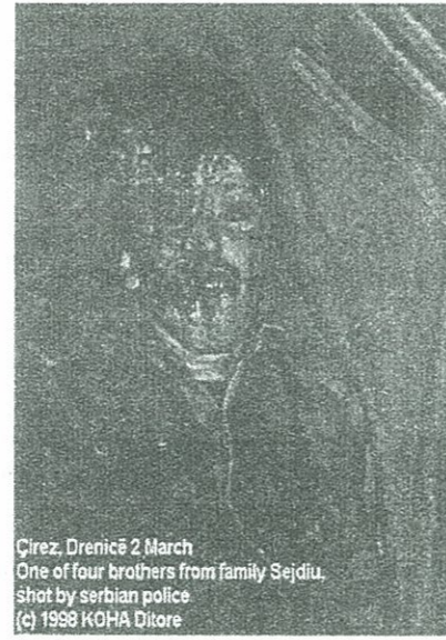
Çirez, Drenicë 2 March One of four brothers from family Sejdiu. Shot by serbian police