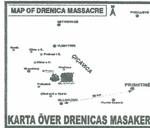
KARTA ÖVER DRENICAS MASAKER

Serbisk massmedia påstår att dem hade inte döda barn eller kvinnor. Dem hade bara dödat Albnska terrorister.