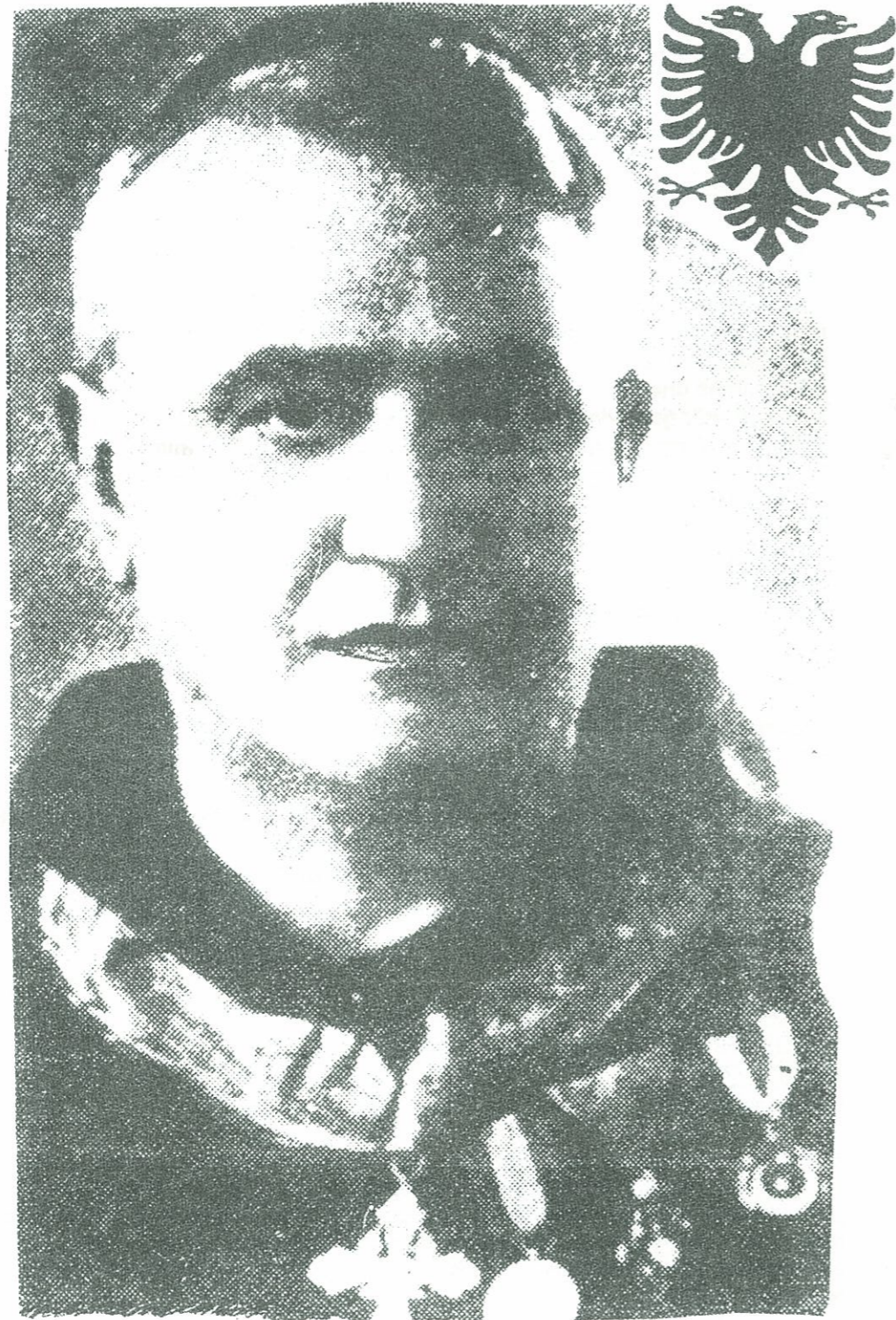
At Gjergj Fishta - Homeri shqiptar Ka lindur më 1871 Vdiq më 30.12.1940

Revistë kulturore - informative Shoqata Besa, në Trelleborg-Suedi Kultur-och informationstidskrift Föreningen Besa i Trelleborg-Sverige