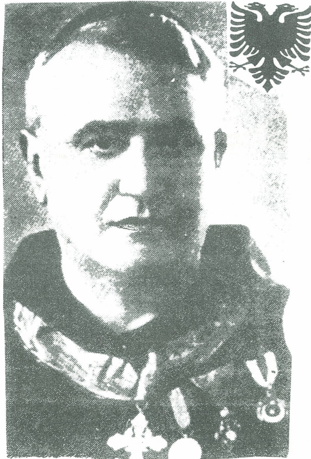
At Gjergj Fishta - Homeri shqiptar Ka lindur më 1871 Vdiq më 30.12.1940

Revistë kulturore - informative Shoqata Besa, në Trelleborg-Suedi Kultur-och informationstidskrift Föreningen Besa i Trelleborg-Sverige